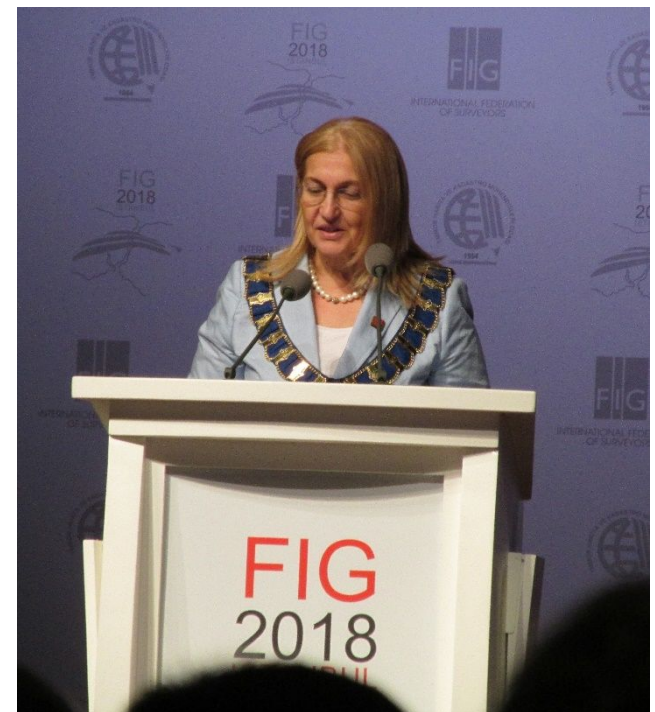
Chryssy Potsiou FIG会長