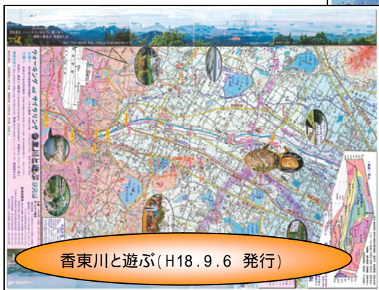
香東川と遊ぶ(H18.9.6 発行)