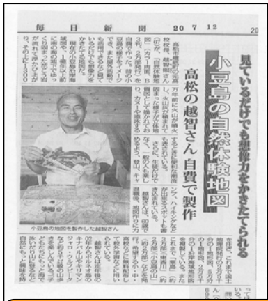
「自然体験地図(小豆島の海と山に遊ぶ)」が紹介された新聞記事 - H20.7.12 付け毎日新聞 -